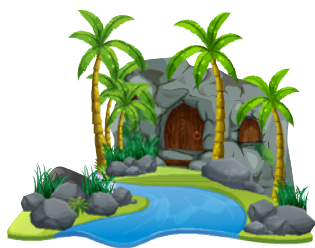
ISOLA DELLA VITA Per offrire ai bambini un incontro con il linguaggio dell'arte a 360°