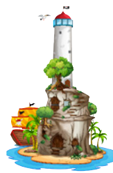
ISOLA DELL'INNOVAZIONE Fare coding, realizzare fumetti con scratch, comandare un robot