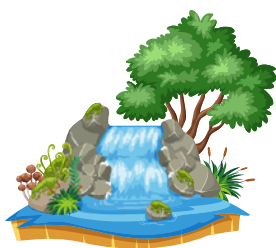
ISOLA DELL'ENERGIA Per far conoscere ai bambini il tema dell'energia pulita