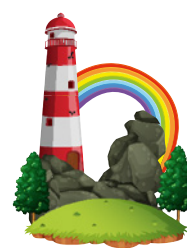
ISOLA DEL CIBO laboratori di lavorazione degli ingredienti naturali, cucinare è un gesto di autonomia